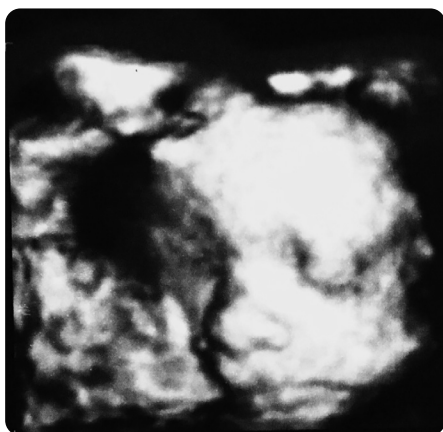
Figura 2. Imagen en 3D en la que se aprecia el rostro fetal sin alteraciones morfológicas.